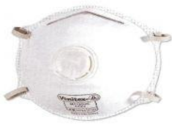
Μάσκα υψηλής προστασίας( FFP3)